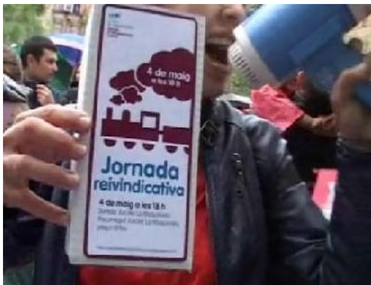
Manifestació dels pares dels alumnes del CEIP La Maquinista al carrer Sao Paulo-Ferran Junoy. Maig 2010

Per una cosa o una altra, les reivindicacions en el barri per on estem corrent ha estat una constant durant molts anys. Ara segueixen. I no és que aquest escrit vulgui ser una proclama de les mancances que encara té l'indret, però no em puc estar de fer esment a que, potser, en passar per aquest carrer de Sao Paulo , ens vindrà a la memòria unes imatges recents per televisió, de fa dos mesos exactament, i ens solidaritzarem amb el que reclamaven. Els pares del CEIP La Maquinista -hi passarem a tocar quan girarem- van tallar el carrer demanant que no s'endarrereixi més la construcció d'una escola definitiva, perquè els seus fills fan les classes en uns barracons des de fa dos anys.