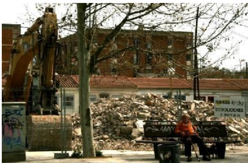
Enderroc de Les Cases Barates del Bon Pastor. .

Les Cases Barates del Bon Pastor estan avui en procés d'extinció, a punt de no quedar-ne ni rastre. Un procés no gens fàcil perquè molts veïns no volien marxar de casa seva, per més que poguessin estar millor en un altre habitatge vertical, producte de la transformació del barri.