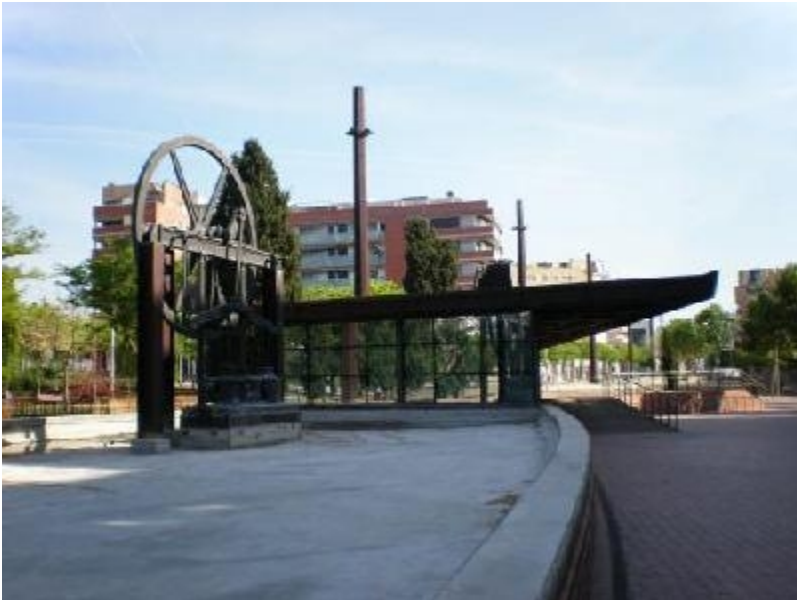
La Roda i La Proa al Parc de la Maquinista

En passar, veurem el monument a La Roda , una reproducció exacte de la primera màquina de vapor que va construir La Maquinista el 1855, i una estructura metàl·lica que vol ser la proa d'un vaixell, una mostra del que produïa l'empresa en els terrenys que avui són el parc.