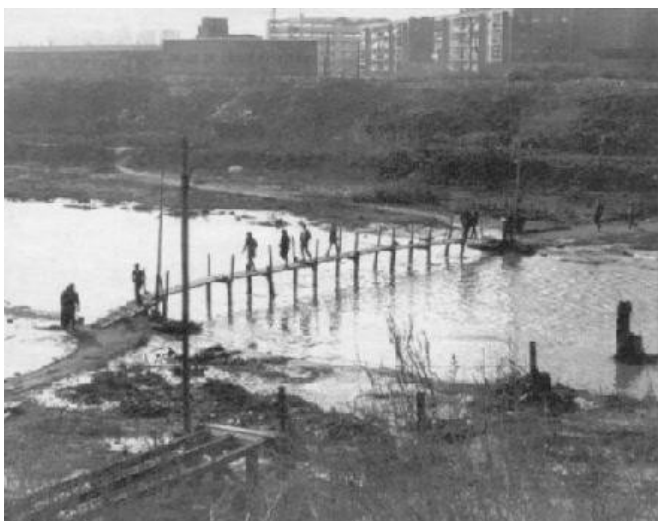
Dir que el barri del Bon Pastor era una zona oblidada en els temps del franquisme no és cap mentida. Passera de fusta que permetia passar el riu als treballadors de La Maquinista, o altres veïns, que vivien a Sant Adrià. Foto de 1968 del lloc on ara hi ha el Pont del Molinet, a dos-cents metres d'on correrem.

En girar pel carrer de Sant Adrià i avançar, intuirem que a la nostra esquerra hi ha el nucli de les cases barates que li donen vida al barri. Fins ara, pel carrer d'abans, l'únic que haurem vist a dreta i esquerra són empreses i magatzems, de cases cap ni una. No és doncs un carrer distret; en tot cas, el terreny és pla -com quasi tot el circuit- que és d'agrair. I a la meitat del tros que farem d'aquest carrer, hem de trobar l'indicador del Km 1 (i el del 6 de la segona volta).