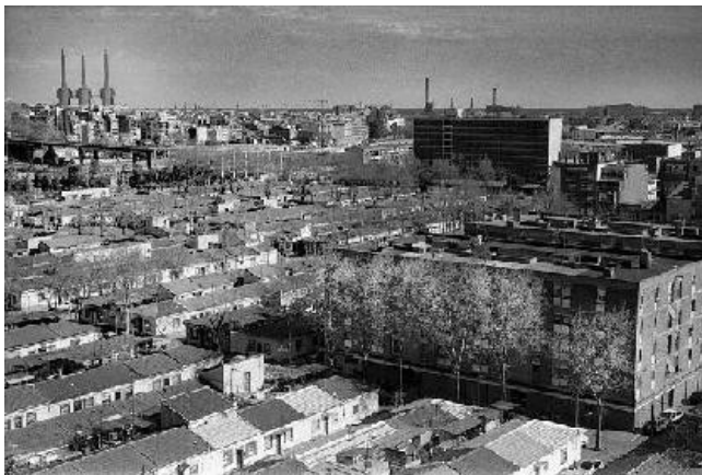
Les Cases Barates del Bon Pastor. Any 2004.

Enguany, a diferència de l'any passat, la cursa no passarà pel mig de les Cases Barates , un grup d'habitatges modestos aixecats a finals dels anys 20 que, en la meua opinió, conformen el que és el barri. La ciutat, en aquella època, rebia molta immigració del sud d'Espanya i tenia un greu problema per ubicar als nouvinguts. La dictadura de Primo de Ribera va impulsar la construcció de cases unifamiliars en llocs apartats del centre que, com les del Bon Pastor , van constituir durant molts anys els signes d'identitat del barri. Les Cases Barates del Bon Pastor estan avui en procés d'extinció, però encara n'hi ha moltes. Un procés no gens fàcil perquè hi ha molts veïns que no volen marxar de casa seva, per més que poguessin estar millor en un altre habitatge (és un dir), producte de la transformació del barri. És una llàstima que no hi passem.